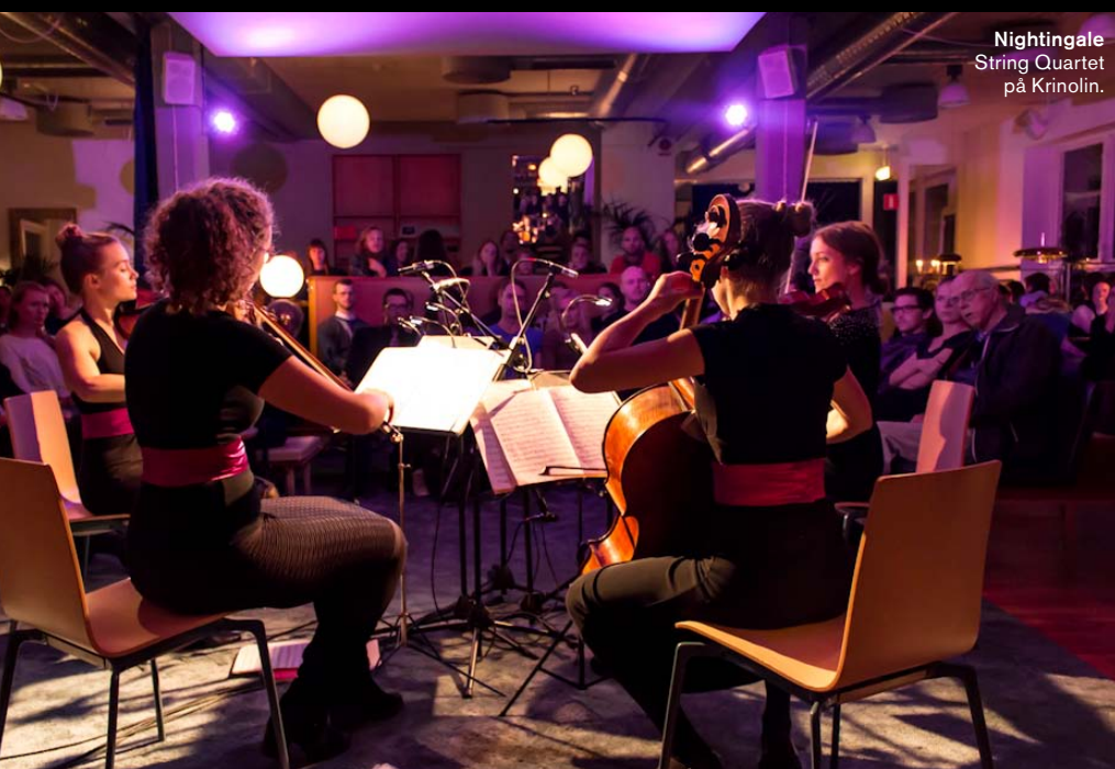
Nightingale String Quartet på Krinolin.

»MUSIKEN ÄR DET INGET FEL PÅ. DÄREMOT ÄR DET TYDLIGT ATT OLIKA GRUPPER GILLAR OLIKA KONSERTMILJÖER. FÖR MÅNGA UNGA FINNS DET INTE PÅ DEN SOCIALA KARTAN ATT GÅ TILL ETT KONSERTHUS.«