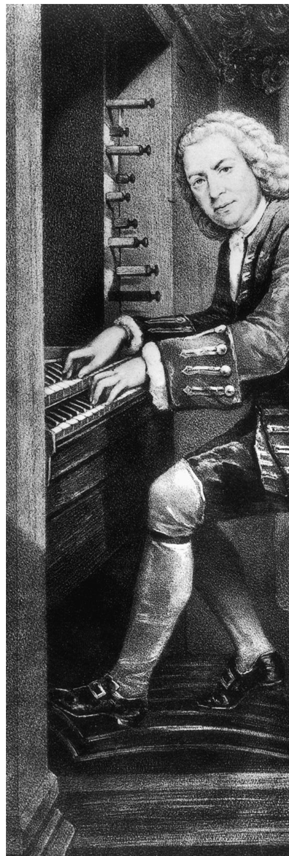
Bach, orgelmästaren (som han var känd som av sin samtid). Gravyr från omkring 1725.

Att fördjupa sig i Bachs musik är att ge sig ut i ett outgrundligt och fascinerande musikaliskt universum. Vi upptäcker hela tiden nya saker, men det tar aldrig slut. Ägna några timmar av julleddigheten till Bachs Juloratorium. Det är en storartad upplevelse, oavsett vad tycker om julen.