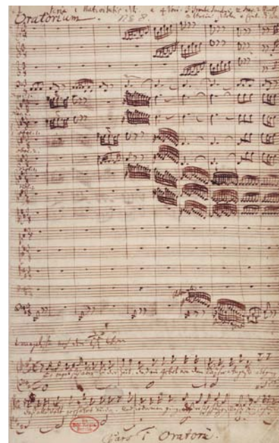
»Jauchzet, frohlocket«. Bachs originalkopia från 1734.

»Som efterträdare till Kuhnau fick man alltså nöja sig med tredjehandsvalet Bach.«